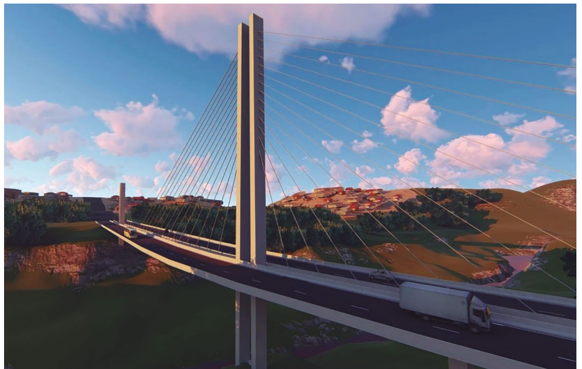
Ainda mobilidade urbana, a ponte estaiada, que liga duas grandes regiões da cidade: uma obra futurística