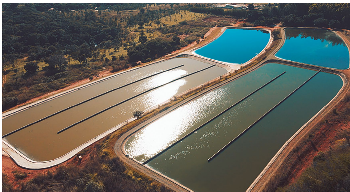
Sistema Nacional de Informações sobre Saneamento: salto de 47% para 75% de cobertura de esgoto sanitário