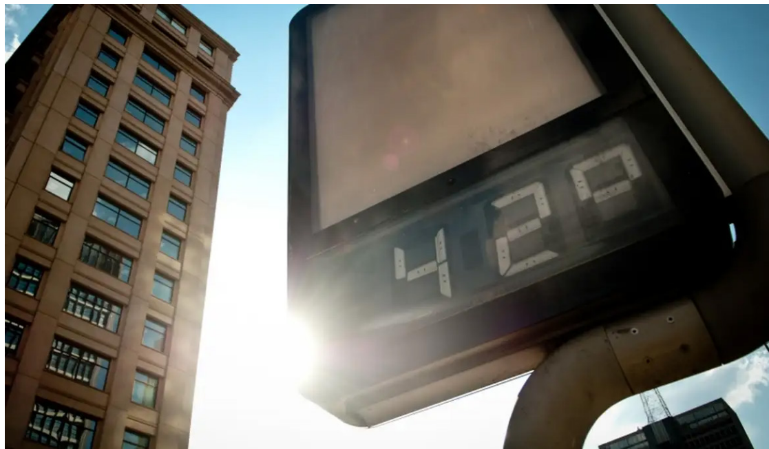
Valor significa aumento de 0,70°C em relação à média de 1991-2020 para janeiro e de 0,12°C sobre o anterior janeiro mais quente, em 2020

“As temperaturas europeias variaram em janeiro de 2024, desde muito abaixo da média de 1991-2020 nos países nórdicos até muito acima da média no sul do continente. Fora da Europa, as temperaturas esti-