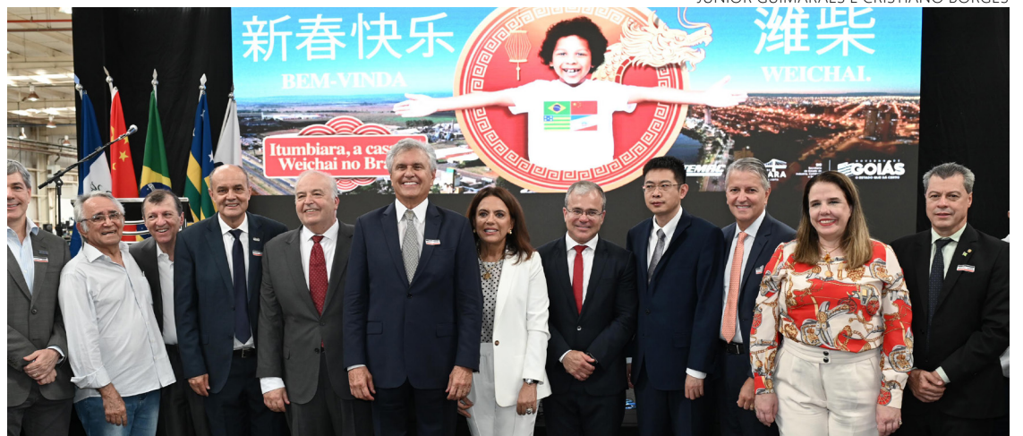
Resultado de prospecção de negócios promovida pelo Governo de Goiás, instalação de empresa chinesa para Itumbiara deve gerar emprego e renda

Com parceria da Stemas Grupos Geradores, a WeiChai utilizará parte de suas instalações para a construção de um centro de montagem e distribuição dos motores da empresa asiática, o que vai representar