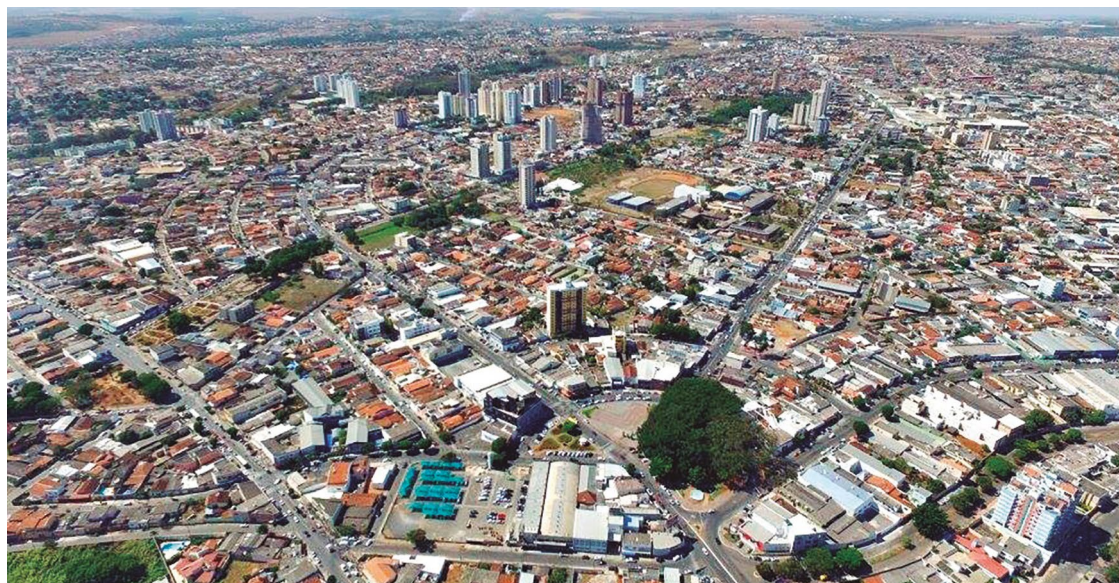
Crescimento superior a 19% faz com que Anápolis se insira no seletor grupo das cidades com 400 mil habitantes

Neste sentido, por exemplo, a Prefeitura afirma que tem atuado - mesmo que não seja de competência municipal - com o programa habitacional 'Meu Lote, Minha História', com a doação de