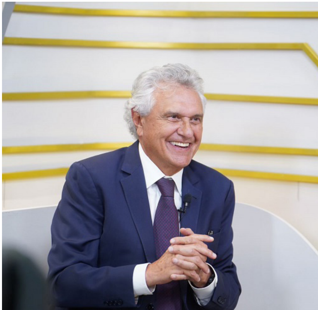
Ronaldo Caiado: candidato apoiado pelo governador tem ampla simpatia do eleitorado

O estudo ouviu 680 eleitores do município de Goiânia com 16 anos ou mais em todas as regiões da cidade, entre os dias 31 de janeiro e 5 de fevereiro deste ano. A margem de erro é