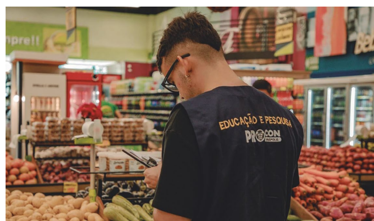
Na pesquisa do órgão de defesa do consumidor, foram identificados alguns produtos com os preços mais baixos, caso da cebola nacional

Já o quilo do limão Taiti teve uma variação de 100%, com o menor preço registrado em R$ 2,99 e o maior em R$ 5,99. O quilo do coco verde mostrou uma variação de 100%, indo de R$ 4,50 até R$ 9.