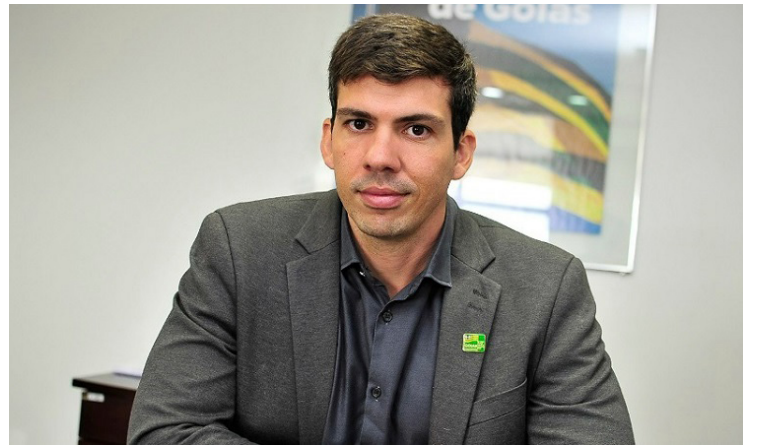
Pedro Sales: Ronaldo Caiado salvou a Saneago após gestão desastrosa do PSDB