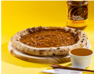
Doce de leite havanna: parceria com pizza prime

Jardim de Carnaval na Casa Chandon Garibaldi. Pela primeira vez em sua história de 50 anos no Brasil, a Casa Chandon Garibaldi abre seu jardim para celebrar o Verão, embalada pela festa mais popular do mundo: o Carnaval. Serão cinco dias de muito