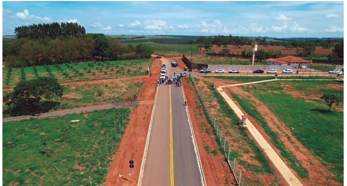
Obras como o anel viário que liga a BR-153 às GO-330, entre outras, colaboram para qualificar o sistema viário

"Os problemas ambientais afetam a população diretamente. Quando se fala em calor, enchentes, falta de água, escassez de recursos, isso tudo é parte da questão ambiental. Então, temos que pensar hoje de uma forma em que a gente veja a população da cidade como parte do meio ambiente. Quando eu falo de melhorar o meio ambiente da cidade, falo exatamente de melhorar a qualidade de vida das pessoas, não tem sentido nenhum falar em meio ambiente se não for para a qualidade de vida das pessoas", concluiu.