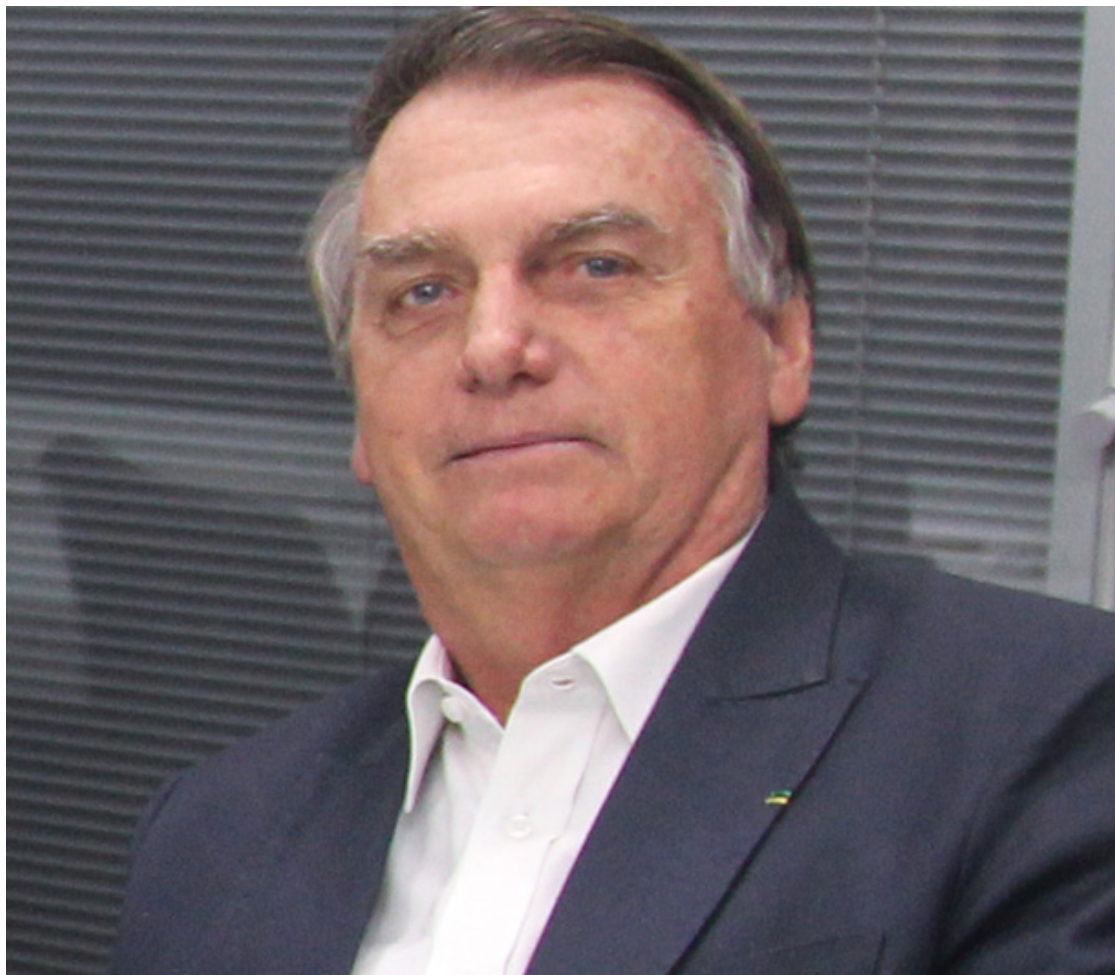
Jair Bolsonaro: Polícia Federal faz investigações sobre atos no exercício da Presidência

Além de determinar a entrega do passaporte, a PF infor-