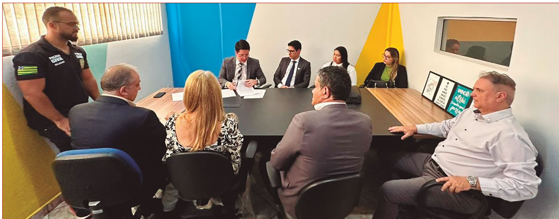
Ato de eleição realizado nesta quarta-feira, 7, na sede da 3ª Delegacia Regional de Polícia Civil, com a presença de servidores e membros da comunidade

O CCSU também tem como finalidades promover a aproximação e a cooperação entre a sociedade e a unidade policial, atuar na conservação do prédio e equipamentos, administrar outros repasses, subvenções, convênios, doações e arrecadações que a entidade venha a receber, e incentivar a criação do Conselho Comunitário de Segurança - Conseg e trabalhar cooperativamente.