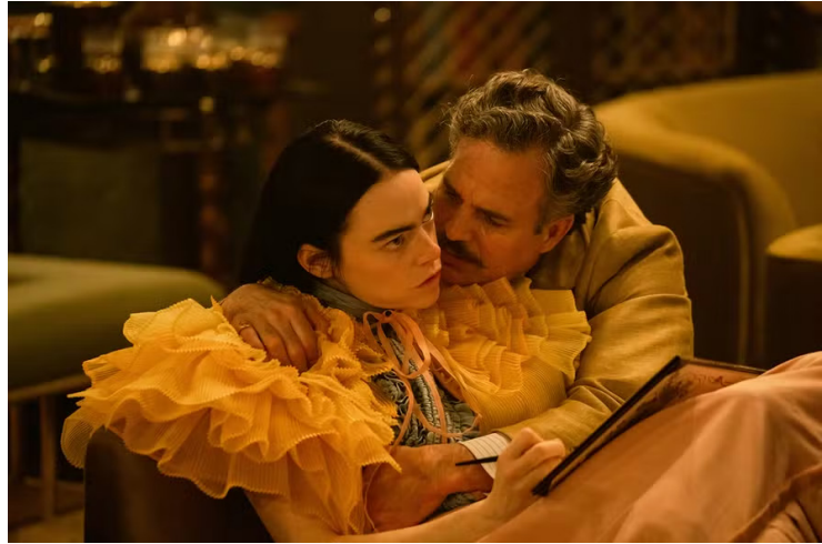
Filme não tem medo de falar coisas difíceis ao espectador