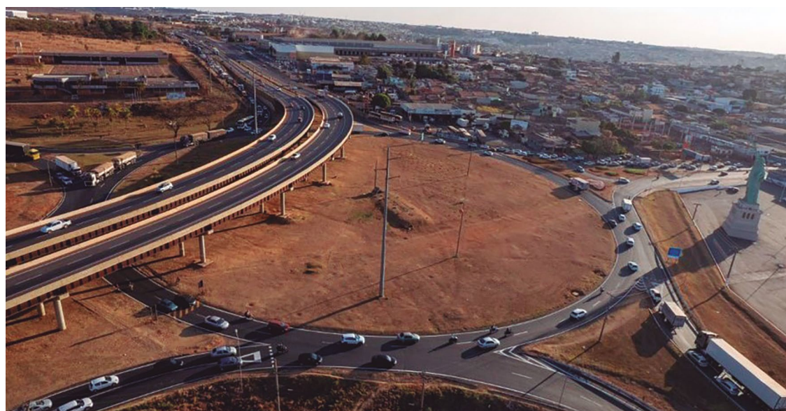
ECOVIAS DO ARAGUAIA