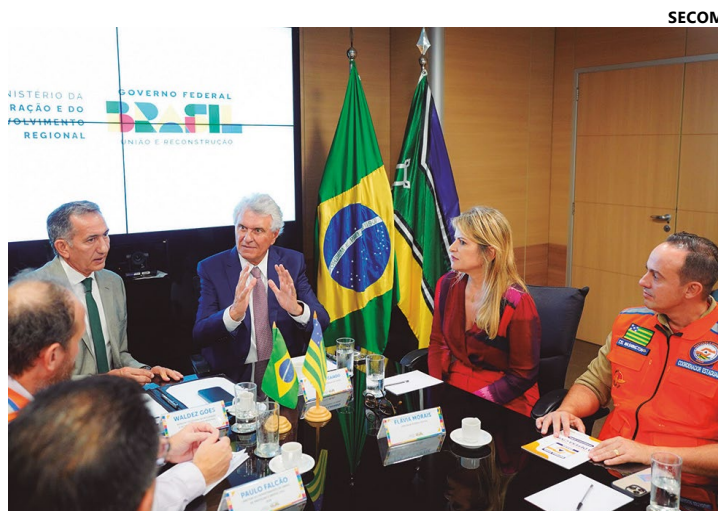
Governador Ronaldo Caiado, na audiência com ministro Pedro Rezende

A portaria federal formaliza a emergência nos municípios de Acreúna, Amorinópolis, Araguapaz, Arenópolis, Baliza,