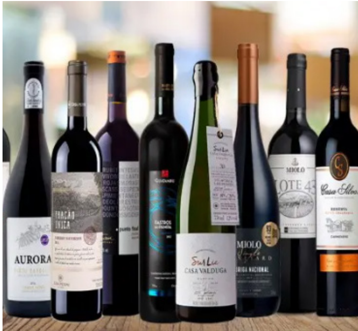
Vinhos brasileiros, cada vez mais, agradam paladar do público